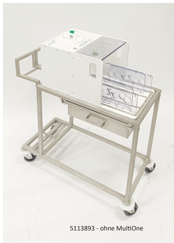
5113893 - ohne MultiOne