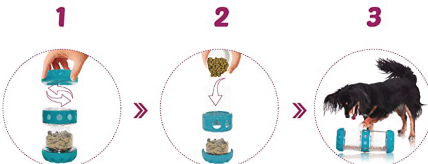
1 Open the cover