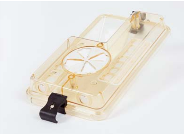
Filterhaube mit CO 2 -Membrane und Befestigungsklammern für Käfig Typ 2 L