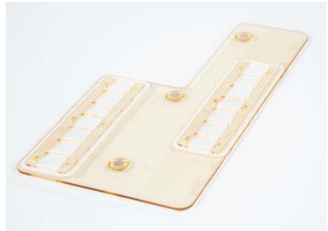
Filterebene, bestehend aus Belüftungsdeckel, Spannrahmen und Filtervlies für Filterhaube Typ 2 L