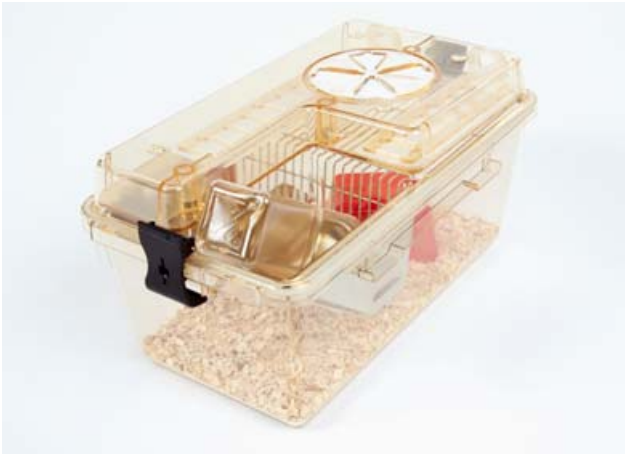
Kompletter IVC Käfig Typ 2 L inkl. Käfigschale, Edelstahldeckel, Filterebene, Filterhaube inkl. CO 2 -Membrane und Tränkflasche

ZOONLAB IVC Käfige bieten eine Vielzahl an Variationen und Anpassungsmöglichkeiten, um optimal für Ihre Einsatzzwecke geeignet zu sein. Zudem sind die kompletten Käfige, aus Polycarbonat bis 121°C und aus Polysulfon bis 134°C, autoklavierbar.