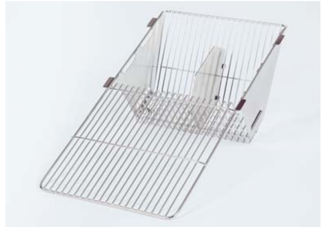
Edelstahldeckel, mit klappbarem Trennblech für Typ 2 L Käfigschale