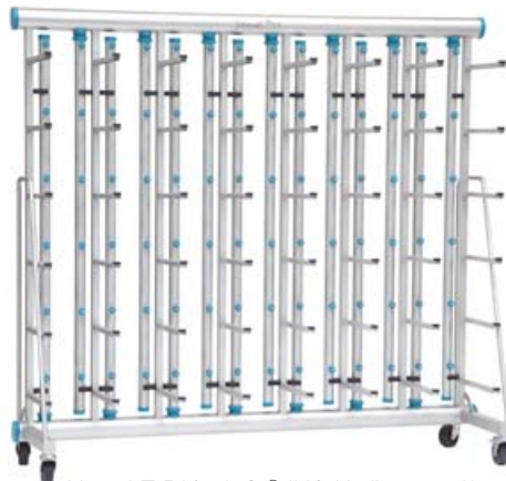
Vent LT BIO. A.S.® IVC Käfiggestell

Die aus Edelstahl gefertigten Gestelle Vent LT BIO. A.S.® für IVC-Käfige zeichnen sich durch ihr geringes Gewicht und ihre einfache Handhabung aus. Die Montage der Gestelle erfordert kein Werkzeug. Weitere Optionen auf Anfrage.