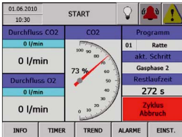
TFT Touchpanel Startbildschirm