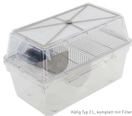
Käfig Typ 2 L, komplett mit Filterhaube