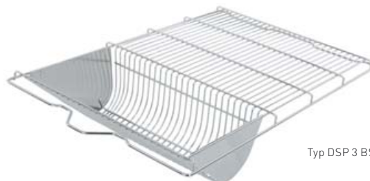
Typ DSP 3 BS, 5023613