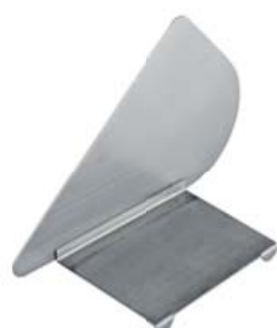
Trennblech TB 2-BS

Zur Aufteilung der Raufe zwischen Futter und Flasche