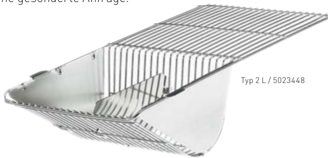
Typ 2 L / 5023448

Auf Wunsch sind auch Gitterdeckel ohne Raufe oder mit einseitiger Flaschenraufe lieferbar. Hierzu bitten wir um eine gesonderte Anfrage.