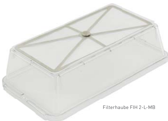
Filterhaube FIH 2-L-MB

eine auswechselbare Filtermatte. Hierbei zu verwendende, innenliegende Gitterdeckel siehe Deckel-Tabelle.