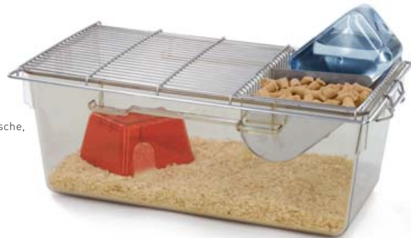
Käfig Typ 2 L mit Tränkflasche, Gitterdeckel und Zubehör

Weitere Hinweise finden Sie in der Broschüre „Käfigaufbereitung in der Tierhaltung“ des Arbeitskreises AK KAB: www.tiz-bifo.de/download/publikationen/ak_kab/ak_kab.html