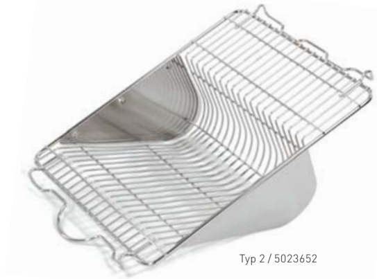
Typ 2 / 5023652