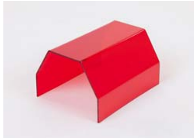
Haus für Meerschweinchen