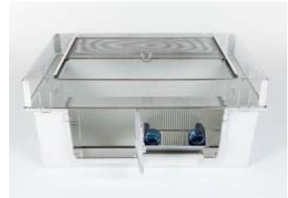
MZK 80/25L mit erhöhtem Abdeckgitter für Mäuse- und Rattenhaltung